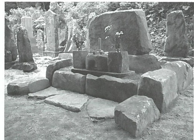
地場産の室根石を使った施工例(東北協同石材(株))

地元岩手県産の「姫神石」を筆頭として、各種石材や一部地域のみ流通している「千蔵石」「室根石」「蔵王石」などもあり、各社それぞれの特徴や独自性を打ち出した内容とし、切削機で原石をカットするユーチューブ動画なども貼り付ける予定だ。五社それぞれの加工設備や技