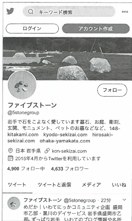
ツイッター上のグループ名「ファイブストーン」スマホ画面（一部）

ターで約四千数百件のフォロワー数を得ている事例が見つかった。ユーザー名は「ファイブストーン」。その発信元を調べたところ、岩手県内の石材店五社が、共通の名称（ニックネーム）アカウントを使って、それぞれの思いや日常の出来事などを共同で発信していた。去る三月下旬、そのメンバーが集まる定例会議が