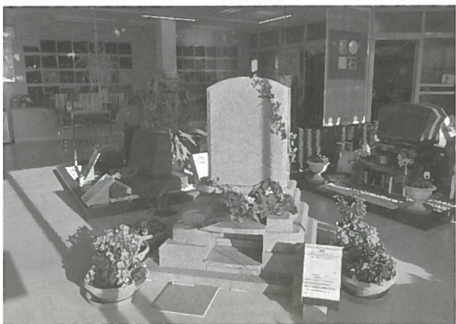
自社加工した磐梯みかけ(極上)の洋型墓石(南昆石材店)

時には有害サイトへの誘導が目的と見られるセクシー系の投稿が紛れ込んだりするが、「フォロワー数を増やしたいばかりに安易な気持ちでフォローすると、同様の投稿が増えてしまい、そのユーザーに対する評価や信用度が落ちてし